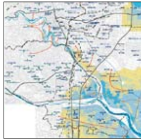
仙台市洪水ハザードマップ→

ダムや堤防、ポンプ場等は整備されたが、想定を超える大雨の場合には地域が浸水することを知り、注意点を確認する。